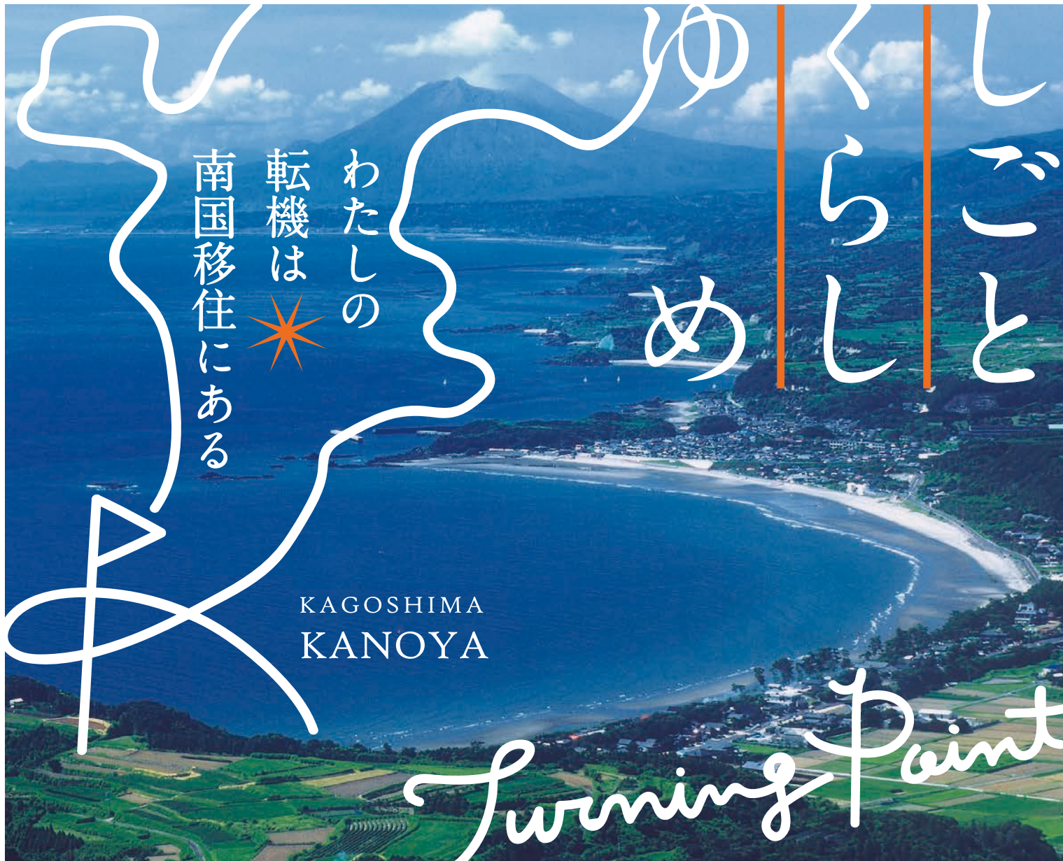
かのや「ばら」と「海」フォトコンテスト2004入選「桜島遠望」